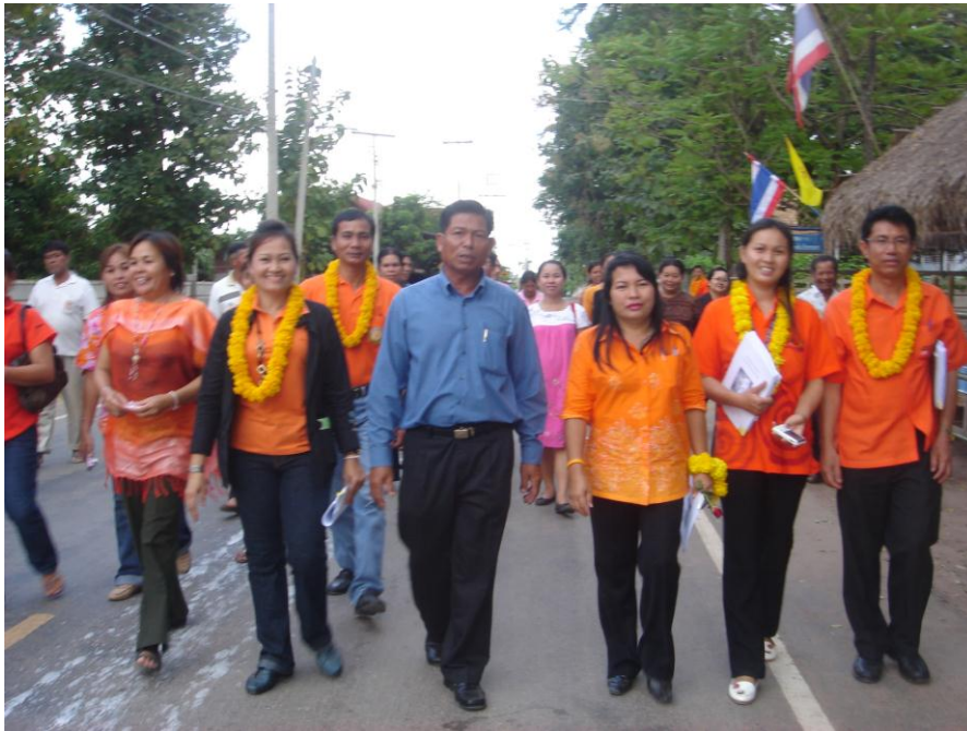
รูปประกวดหมู่บ้าน